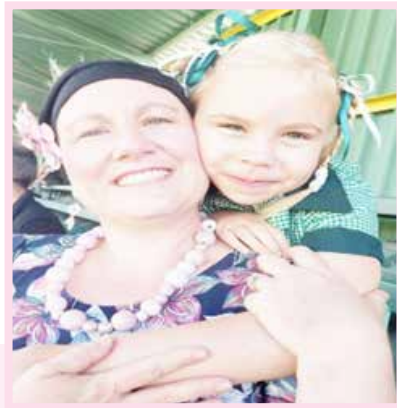
Eerste dag in graad 1