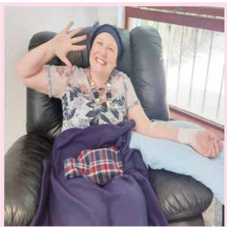
Sessie twee en sessie vyf van chemoterapie