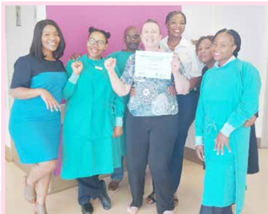
My laaste van 31 sessies bestraling

Gedurende my bestralingstydperk handel ek al my uitstaande forensiese verslae af, lees baie boeke, doen scrapbooking en verf drie groot paint by numbers -skilderye. Die ses weke vlieg om en kort voor lank is die bestraling klaar en is ek weer uit en tuis by my eie huis. Nog iets op die lysie wat ons kan afmerk.