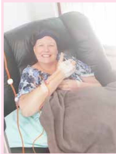
My laaste chemoterapie-sessie