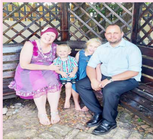
Kersfees 2022 saam as gesin

en herinnering daaraan dat God vir ons gebore is om al ons laste op Hom te neem. Ons besef net weer die wonder van gesondheid, familie en tyd saam en prys God daarvoor.