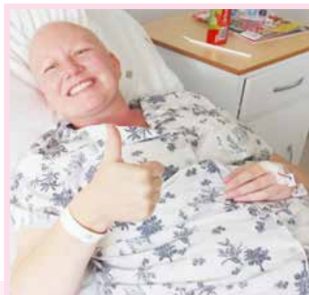
Die dag na my lumpektomie-operasie, steeds in die hospitaal